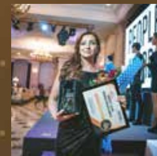
Студия эпиляции года Студия лазерной эпиляции Kudlay_Laserepil