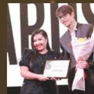
Свадебный салон года Салон Dream Dress