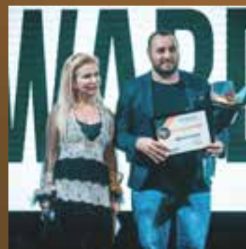
Телешкола года Медиа центр Muzzone