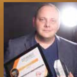
Бизнес-помощник года Республиканский центр помощи предпринимателям