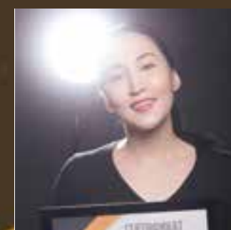
Косметика года Сеть магазинов Asian cosmetics