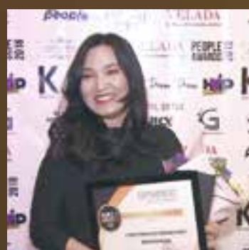
Студия перманентного макияжа года Студия перманентного макияжа Infinity