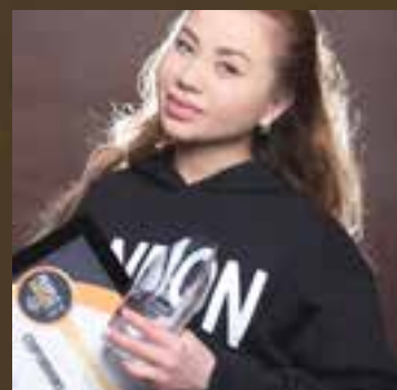
Студия танцев года Спортивный клуб Capre Diem