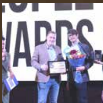
Магазин редкой парфюмерии года "Сеть магазинов Laguna Parfumes"