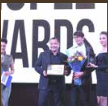
Стоматологическая клиника года Стоматологическая клиника "32 карата"