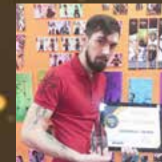
Тату-мастер года Doberman