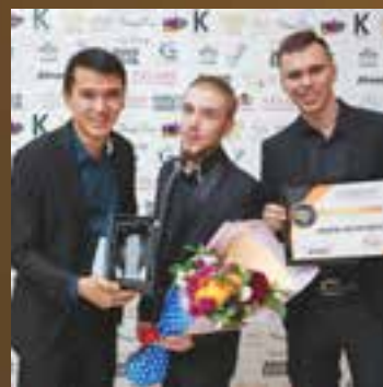
Организаторы детских праздников года Компания "Мир шоу Алматы"